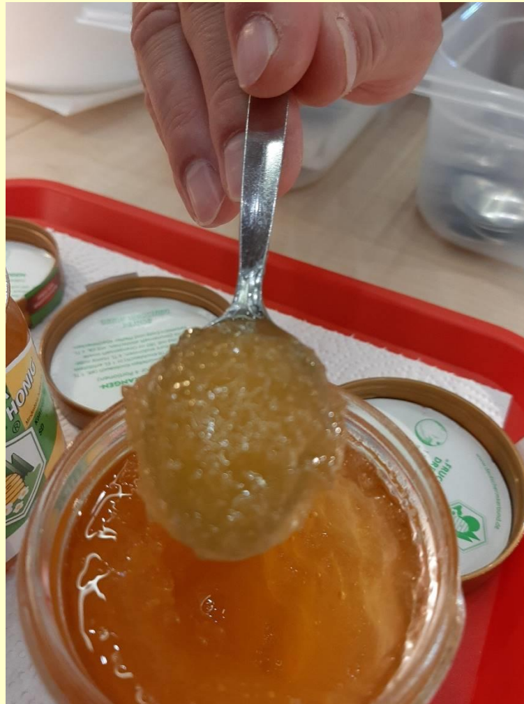
Grobe Kristalle im Honig