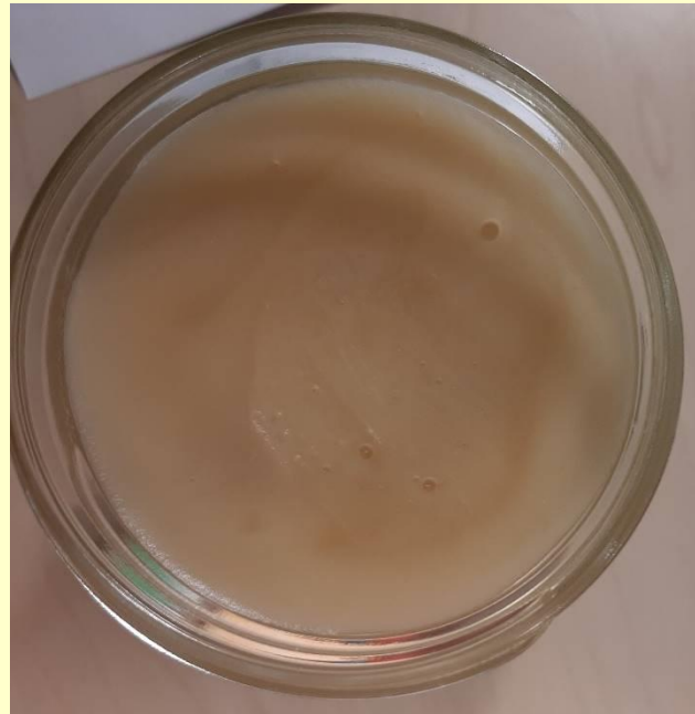
Kleine Bläschen an der Oberfläche