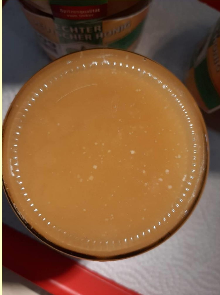
Weißer Stippen im Honig